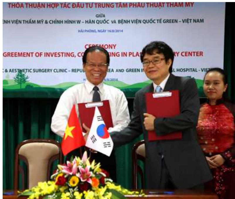
LỄ KÝ KẾT HỢP TÁC BỆNH VIỆN THẨM MỸ HÀN QUỐC

❖ Mục tiêu tổng quát: Lấy mục tiêu ổn định làm gốc để phát triển Tập đoàn; Tăng cường quản trị doanh nghiệp để đạt được sự phát triển bền vững.