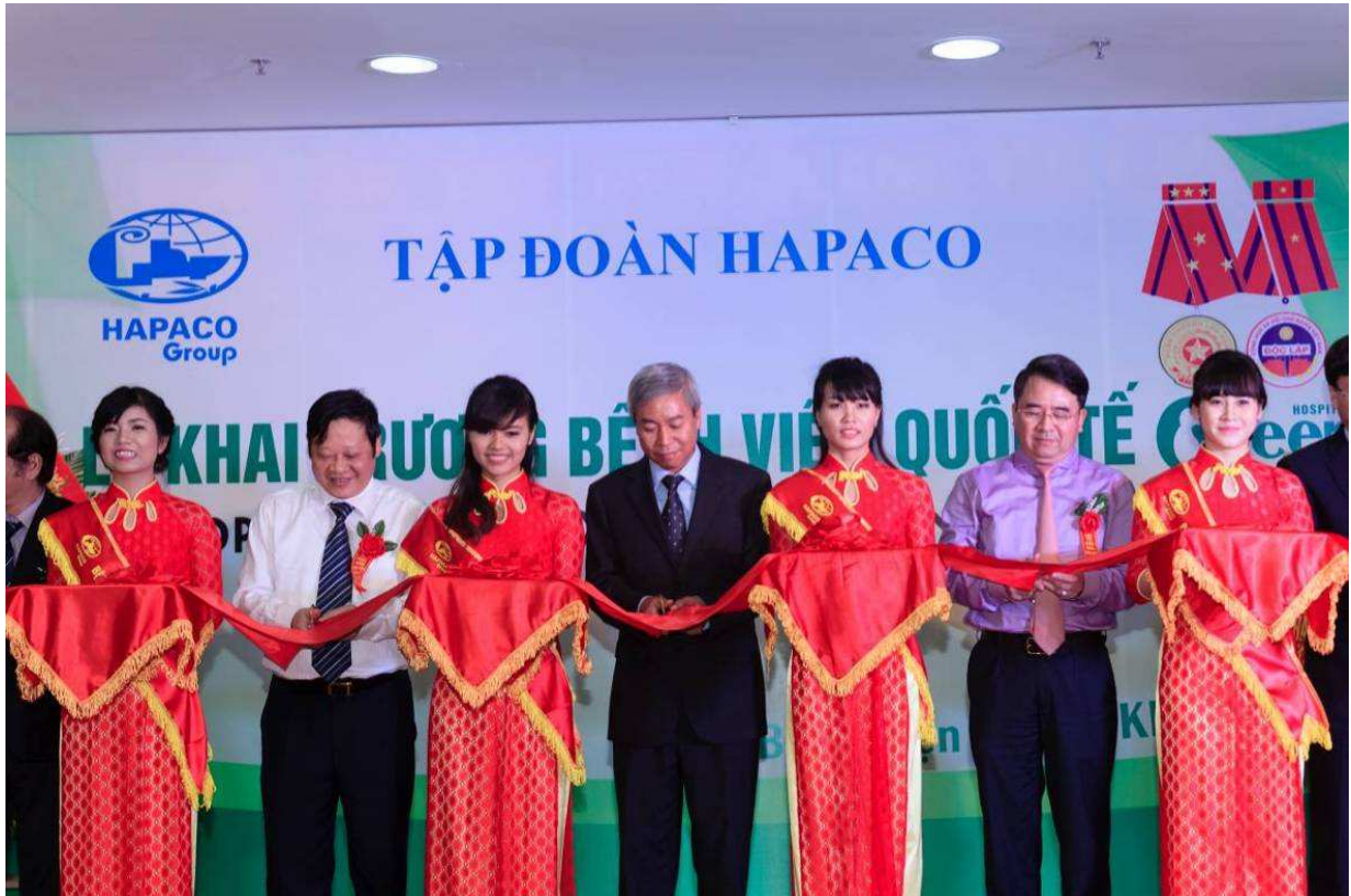
Khai trương Bệnh viện Quốc tế Green