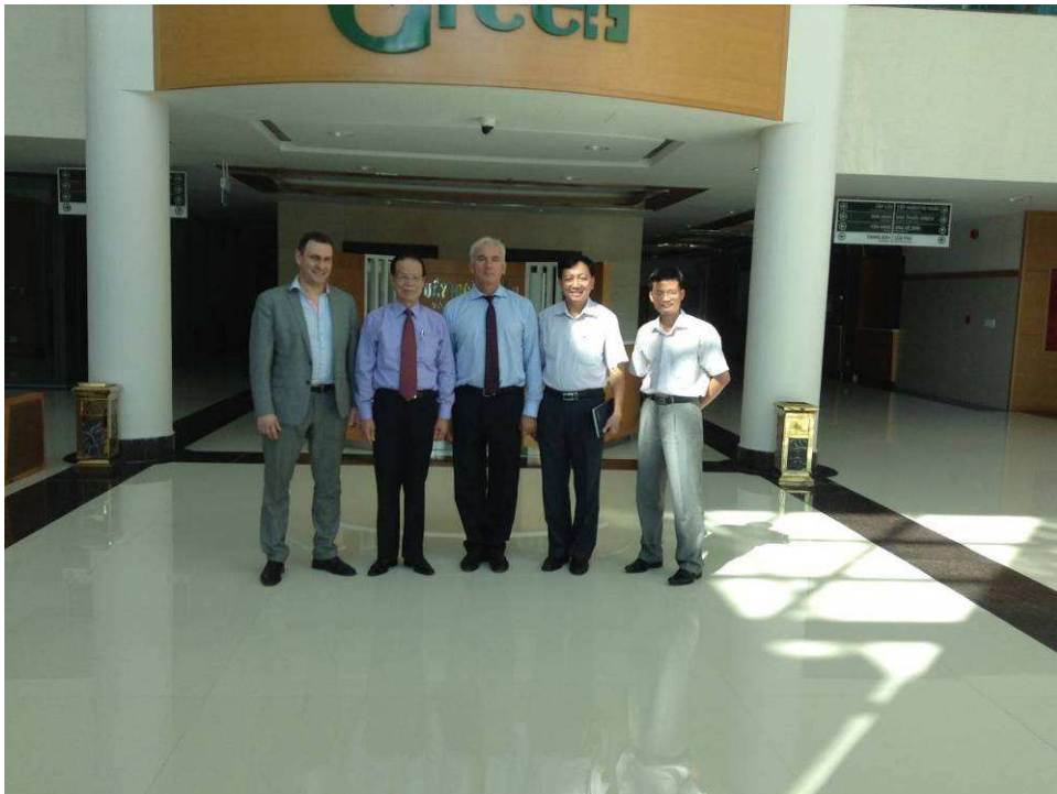
Đại sứ đặc mệnh toàn quyền Cộng hòa Belarus thăm và làm việc tại Bệnh viện Quốc tế Green