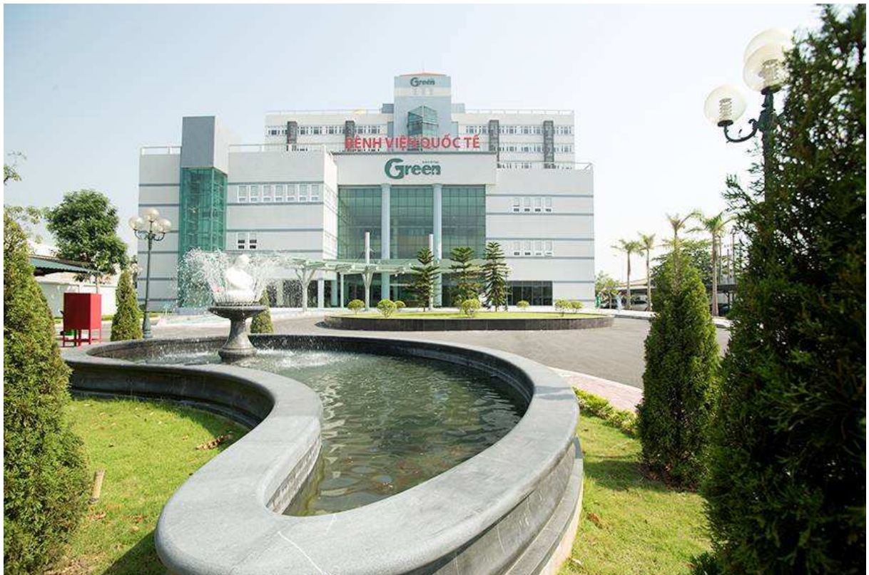
QUANG CẢNH PHÍA TRƯỚC BỆNH VIỆN QUỐC TẾ GREEN

b. Tình hình thực hiện các dự án: Ngày 10/10/2014, Tập đoàn đưa dự án Bệnh viện Quốc tế Green vào hoạt động đúng tiến độ với tổng vốn đầu tư 447 tỷ đồng là công trình chào mừng 85 năm thành lập Công đoàn Việt Nam.