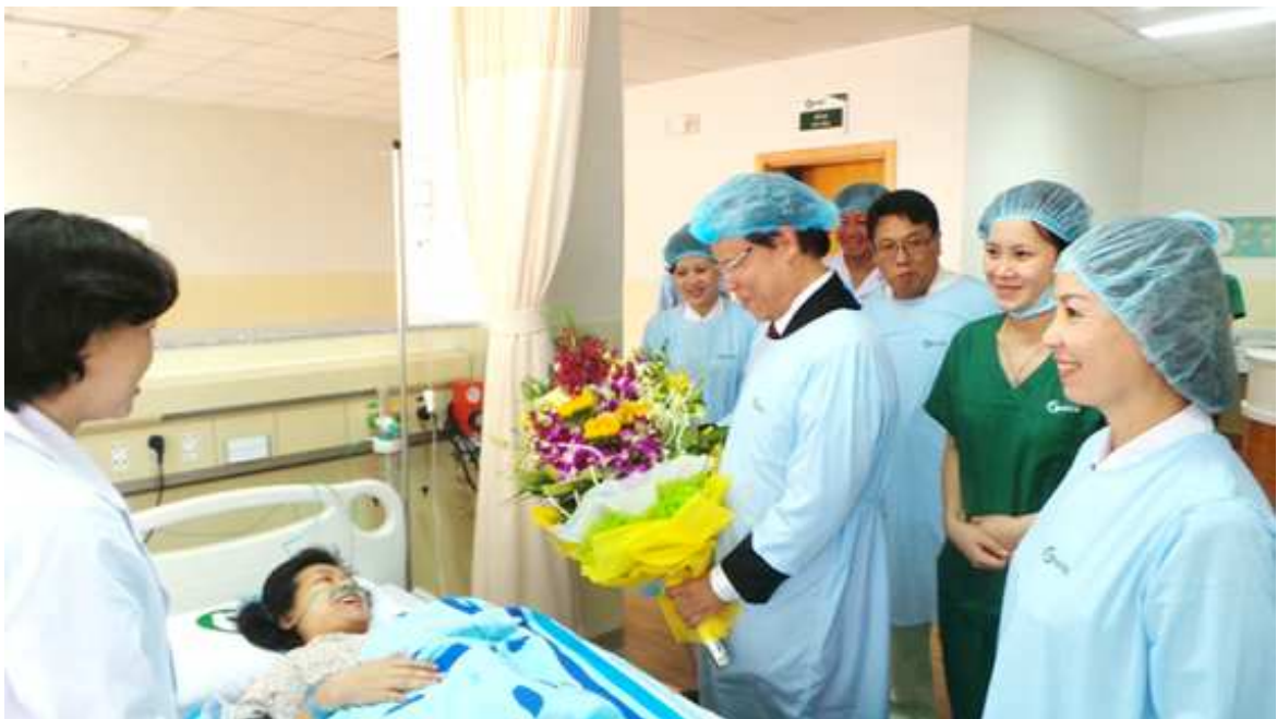
SẢN PHỤ CA ĐỀ ĐẦU TIÊN TẠI BỆNH VIỆN QUỐC TẾ GREEN - 10/10/2014