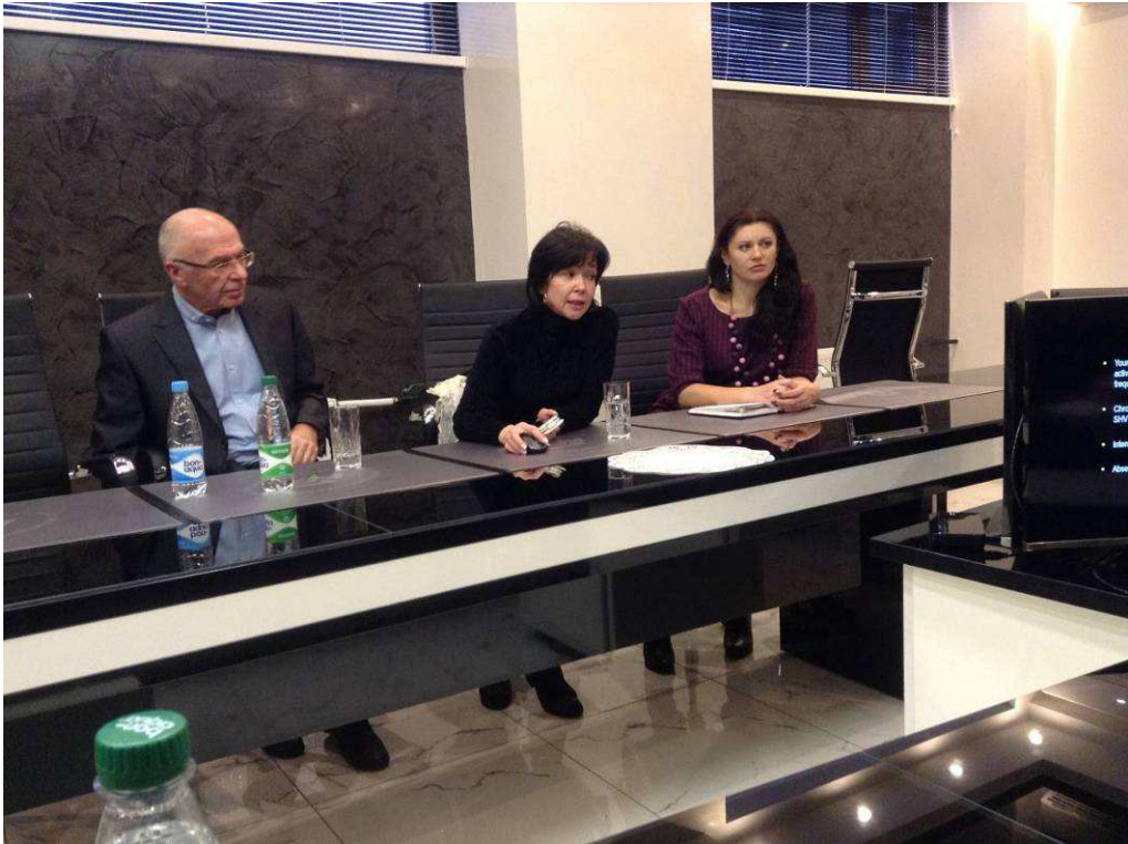
Ban Lãnh đạo Tập đoàn thăm và ký kết hợp tác với Nhà máy sản xuất thuốc chống ung thư - Cộng hòa Belarus