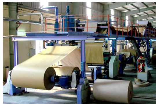
SẢN XUẤT GIẤY KRAFT

Ngày 25/11/2006, Nhà máy giấy Kraft của Công ty đã khánh thành đưa vào sản xuất, đây là nhà máy sản xuất giấy Kraft lớn nhất miền bắc và lớn thứ 2 trong cả nước với công suất 22.000 tấn/năm. Công trình được thành phố Hải Phòng đưa vào công trình chào mừng Đại hội Đảng toàn quốc lần thứ X.