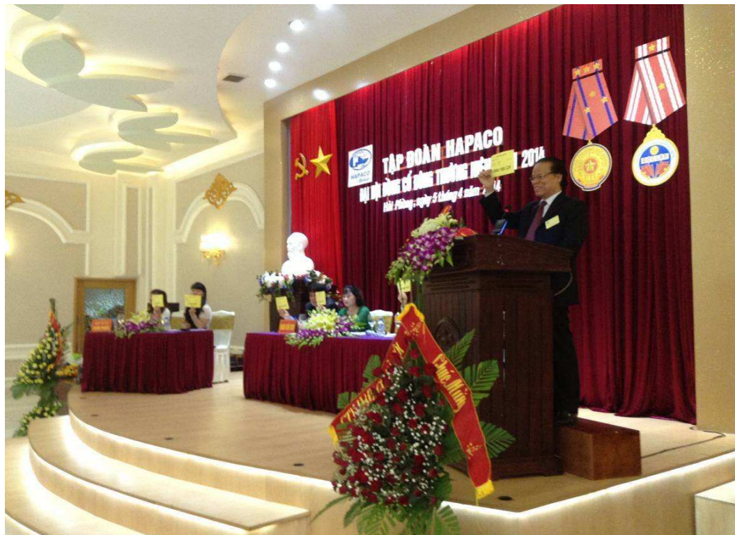
Đại hội đồng cổ đông thường niên 2014