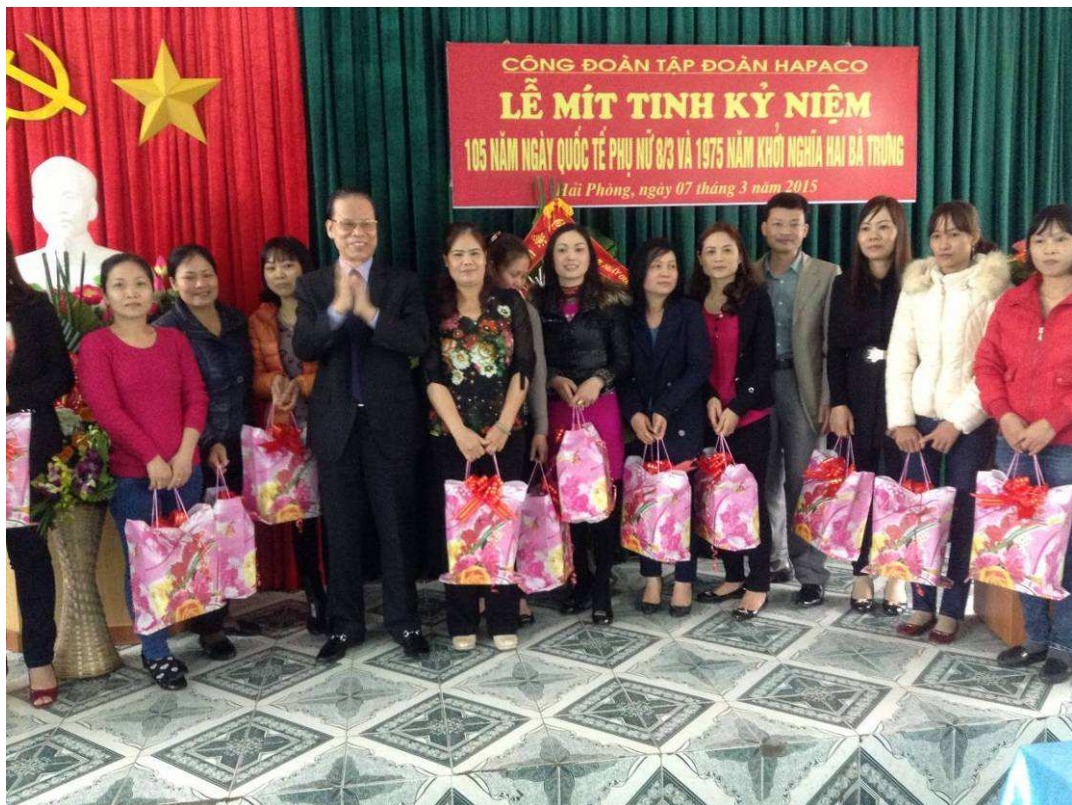
Tặng quà nữ cán bộ công nhân viên tiên tiến xuất sắc