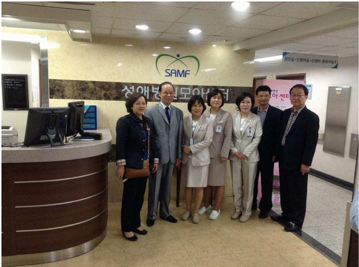
ĐOÀN BÁC SĨ BVQT GREEN THĂM BỆNH VIỆN SUNG AE HOSPITAL HÀN

d. Rủi ro khác: Các rủi ro bất khả kháng như động đất, thiên tai bão lụt, hỏa hoạn, chiến tranh, dịch bệnh...đều ảnh hưởng ít nhiều đến hoạt động sản xuất kinh doanh của Tập đoàn.