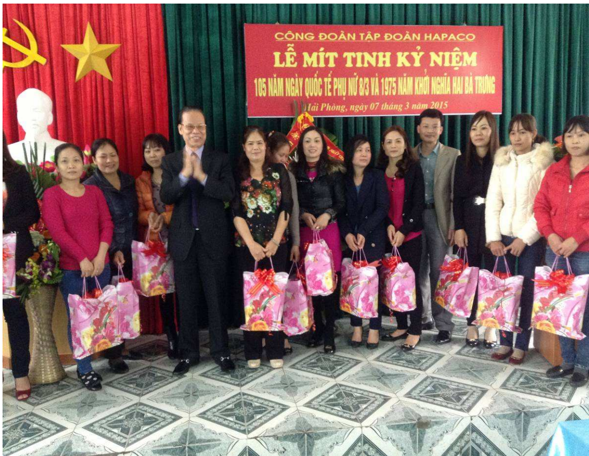
TRAO THƯỞNG PHỤ NỮ TIÊN TIÊN XUẤT SẮC NHÂN NGÀY 08/03.