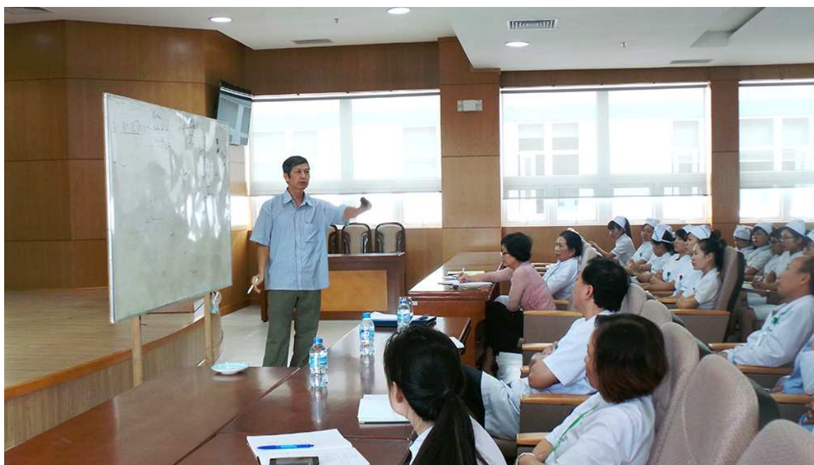
HỘI THẢO TẠI BỆNH VIỆN QUỐC TẾ GREEN

từng dự án; thực hiện tốt công tác tuyển dụng đào tạo, bố trí sử dụng và đãi ngộ đối với từng chức danh, vị trí, từng ngành nghề, từng công việc; phân phối thành quả lao động phù hợp với công sức đóng góp của mỗi thành viên trong quá trình quản lý điều hành và sản xuất kinh doanh, nhằm giữ chân đội ngũ quản lý và lao động giỏi hiện có đồng thời thu hút được nhiều hiền tài đến với Tập đoàn. Thực hiện nghiêm túc việc khoán sản phẩm tới ca sản xuất nhằm tối đa khả năng sáng tạo trong lao động sản xuất của cán bộ công nhân viên, kích thích tinh thần làm việc tích cực và nâng cao trình độ quản lý điều hành sản xuất của mọi thành viên trong doanh nghiệp.