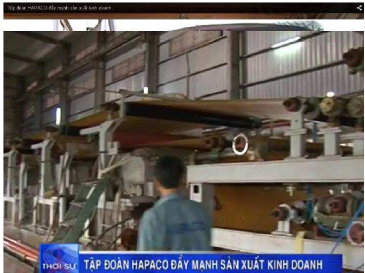
DÂY TRUYỀN SẢN XUẤT GIẤY KRAFT