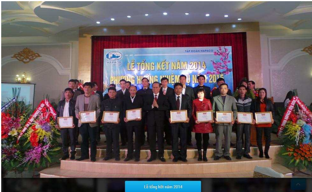
Lễ tổng kết năm 2014