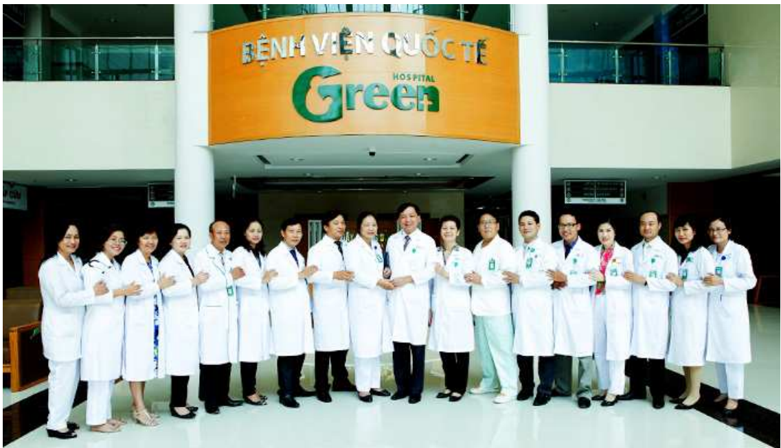
ĐỘI NGŨ Y BÁC SĨ BỆNH VIỆN QUỐC TẾ GREEN