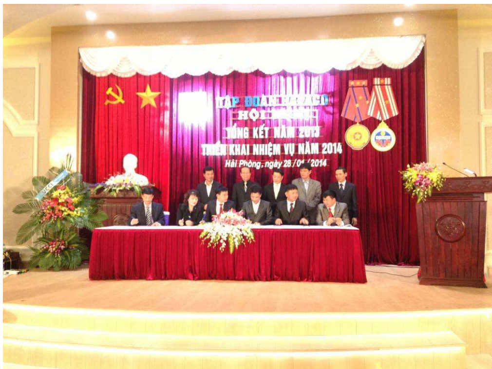
KÝ KẾT GIAO ƯỚC THI ĐUA GIỮA CÁC ĐƠN VỊ THÀNH VIÊN TRONG HAPACO 2014

d. Kế hoạch phát triển trong tương lai: Tập đoàn đề ra các giải pháp cụ thể để thực hiện các mục tiêu chủ yếu cũng như thực hiện chiến lược phát triển trung và dài hạn là: