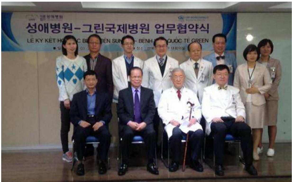
Ban lãnh đạo Tập đoàn thăm và ký kết hợp tác với SUNGAE HOSPITAL Hàn Quốc