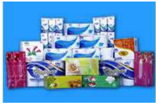
SẢN PHẨM GIẤY TISSUE

Năm 2012, nhằm đáp ứng nhu cầu giấy tissue của thị trường, Tập đoàn đầu tư thêm 02 dây chuyền giấy vệ sinh tại Công ty H.P.P có đủ điều kiện cần thiết cho lắp đặt và đã đưa vào sản xuất.