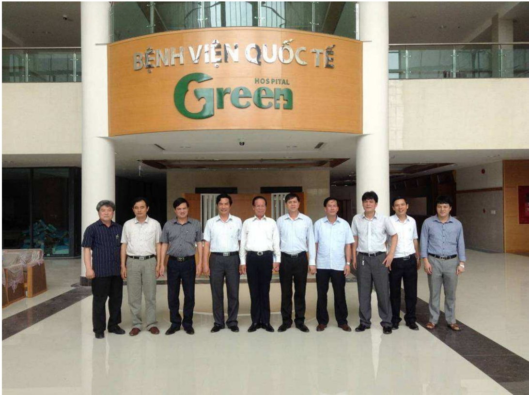
Lãnh đạo UBND Tỉnh Sơn La thăm và làm việc tại Bệnh viện Quốc tế Green